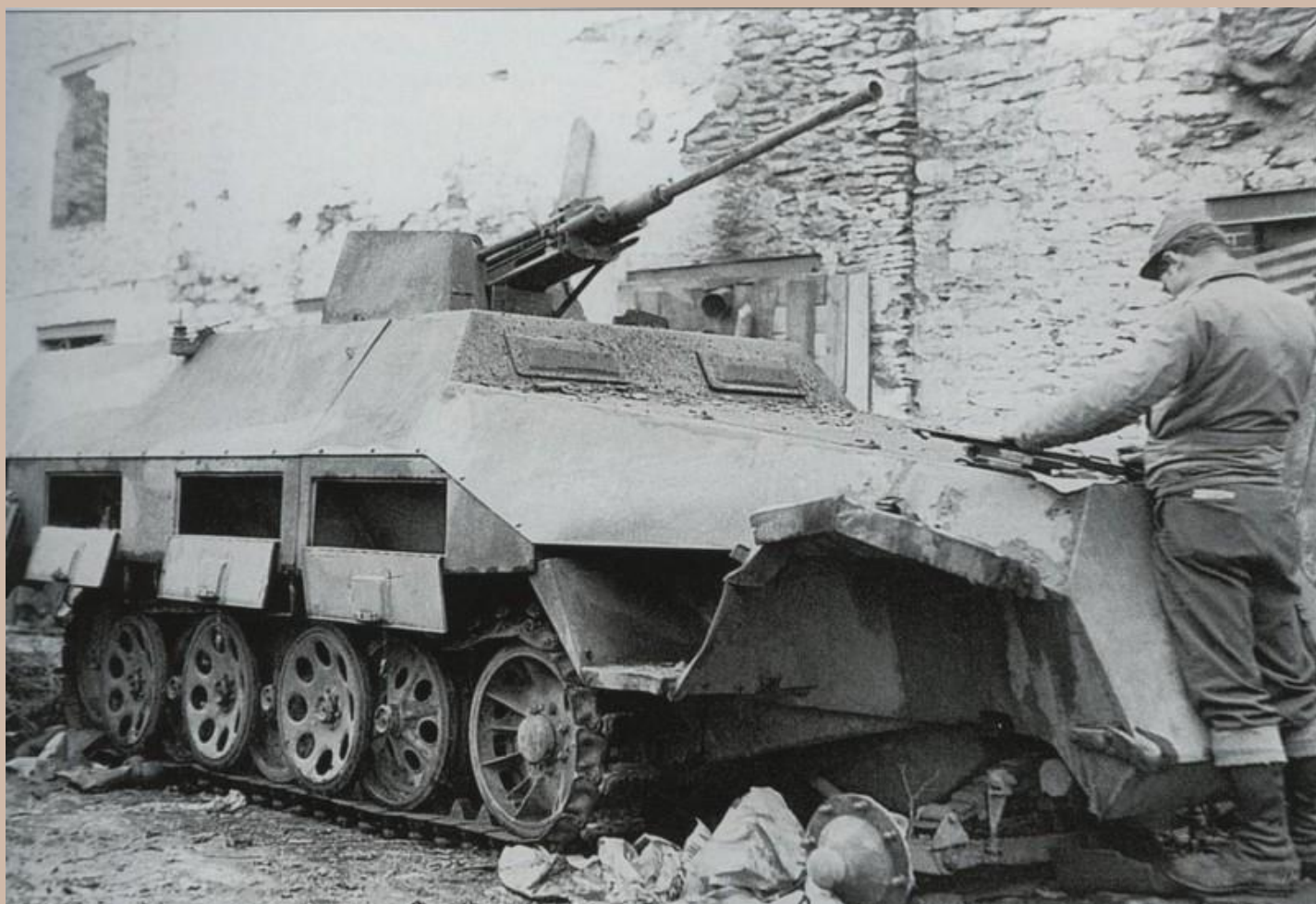
Sd Kfz 251/17 Ausf. D capturé par les troupes US.