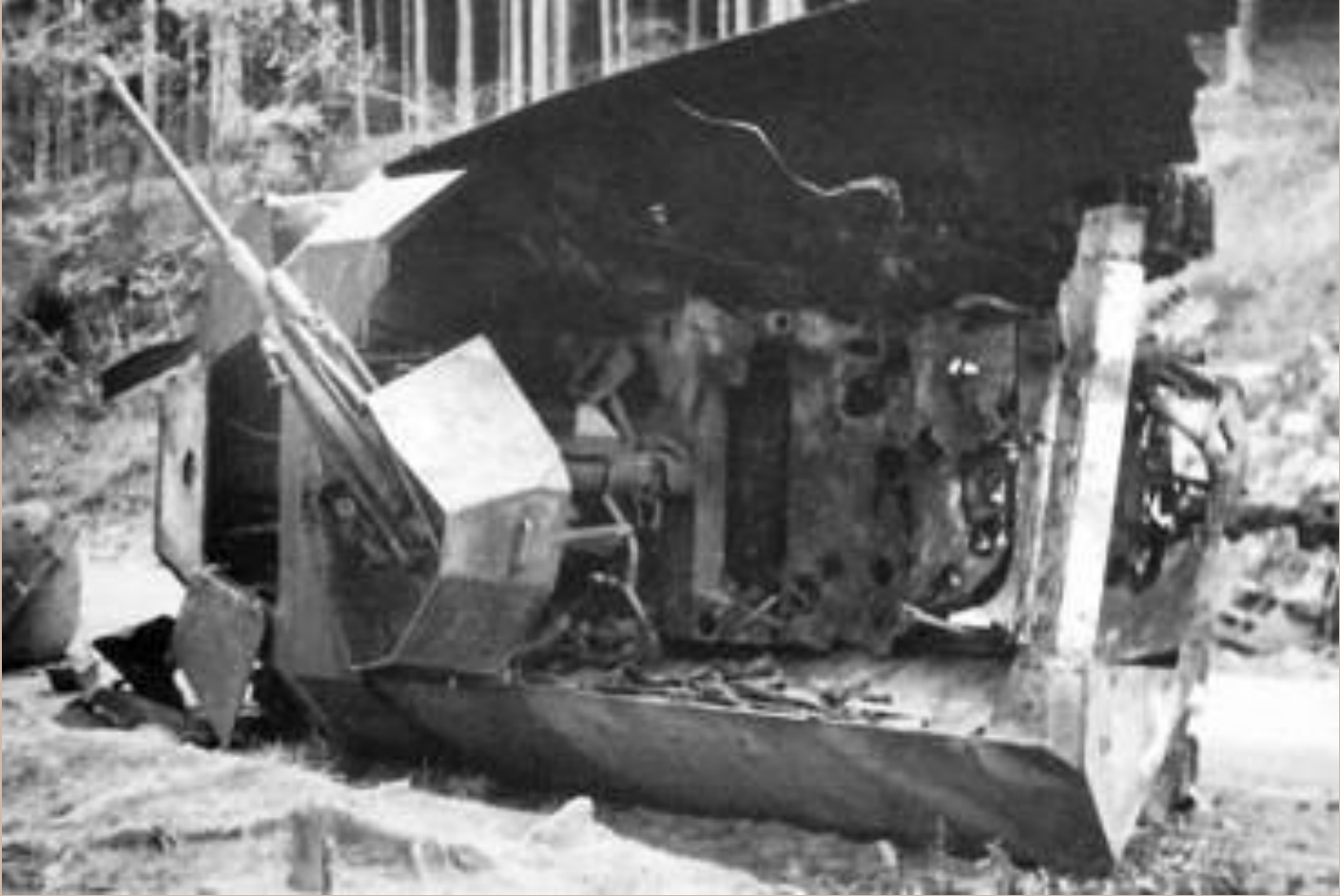
Sd Kfz 251/17 couché sur le flanc ce qui nous permet de visualiser le socle de la pièce de 2cm avec le H fixer au châssis et la potence verticale ou coulisse les sièges des servants.