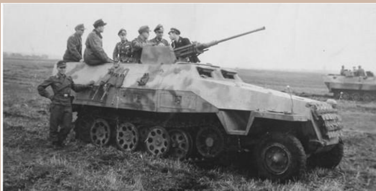
Sd.Kfz 251/17 Ausf. D. Bien du monde a pris place dans ce 251/17 avec des tenues bien différentes.