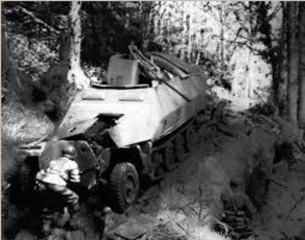
Ce Sd Kfz 251/17 démontre le fait que cet engin ne doit pas trop trainer aux l'avant-postes et n'est pas destiné à défendre une position.