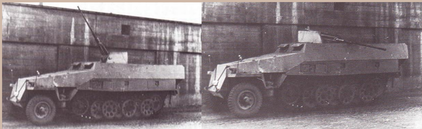
Sd Kfz 251/17 Ausf. D ces deux photos nous montre l'élévation maximale et minimale de la pièce de 2cm.